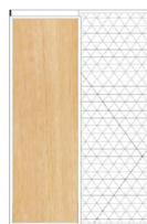
CORREDIZA DE EMBUTIR